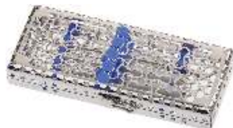
IME14DIN5_ – кассета для стерилизации и хранения 5-ти инструментов.