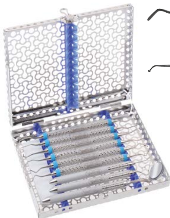
IME12DIN1 – кассета для стерилизации и хранения 10-ти инструментов